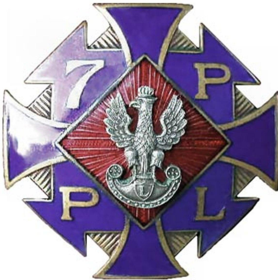
Odznaka 7. Pułku Piechoty Legionów

Opracowanie: Paweł Skrok (IPN Oddział w Lublinie), Dariusz Wajs