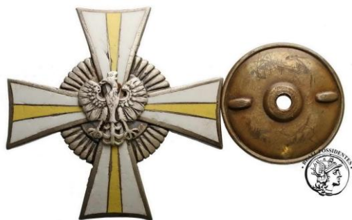
Odznaka Pamiątkowa 24. Pułku Ułanów

Opracowanie: Paweł Skrok (IPN Oddział w Lublinie), Dariusz Wajs